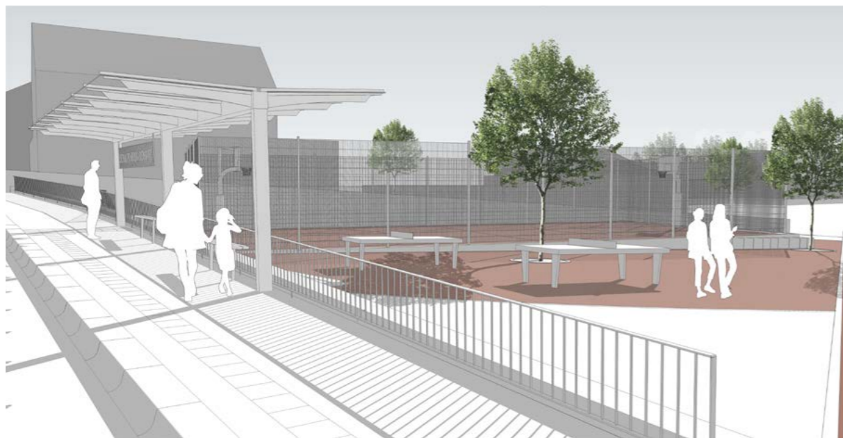
ABBILDUNG: Buswartebereich am Zugang zum Schulzentrum

lände offen sein, damit die neuen Sport- und Spieleinrichtungen von Kindern und Jugendlichen genutzt werden können. Das Bohmter Bewegungsband quert das Schulgelände. Daran reihen sich die Aktions-, Ruhe- und Kommunikationsfelder auf: Kletterlandschaft, Außenklasse, Tischtennis, Multifunktionsfeld, Sitzstufen an der Mensa. Ein Feld aus im Raster gepflanzten Bäumen zieht sich über das ganze Schulgelände, um einen geschlossenen einheitlichen Eindruck herzustellen. Der neu angelegte Parkplatz liegt auf einer ehemaligen Freifläche am nördlichen Grundstücksende. Er wird über eine bereits vorhandene Zufahrt erschlossen. Im Sinne einer Konzentration des Verkehrs werden auch die Fahrradstellplätze den parkenden Autos an der Schulstraße zugeordnet.